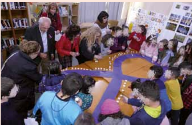
Día contra la Violencia de Género

Coaña prepara una nueva sesión del Consejo Municipal de Infancia, un espacio que hace efectiva la participación de la infancia, de diferentes agentes socioeducativos y de áreas de gestión municipal en pro de un concejo que escucha y da voz a los menores, que lucha por sus Derechos y que cree firmemente en que la mejor inversión de futuro es la dirigida a nuestra población infanto-juvenil.