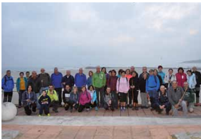
Ruta Foz a Burela 2018

Serán dos las rutas que desarrollaremos en este último trimestre del año, organizadas por la Concejalía de Deportes del Ayuntamiento de Coaña