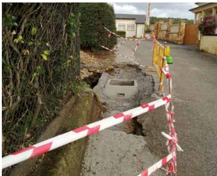
Obras en el camino de El Cañón

Con la puesta en marcha de las mismas una vez finalizadas las obras, el saneamiento de los núcleos de Ortiguera, Jarrio (incluyendo el Hospital) y Coaña, pasará a verter a la Estación Depuradora de Foxos la cual ha sido puesta en marcha el pasado julio.