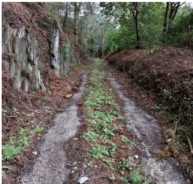
Limpieza de As Grandas de Barqueiros

A esta limpieza periódica se une la limpieza de espacios verdes, áreas recreativas, parques,... así como el Camino de Santiago a su paso por Coaña y la Senda Costera en su tramo Ortiguera – Castello.