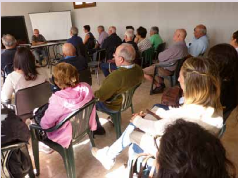
Taller trampeo velutina en Loza

Ante la gran preocupación que provoca la invasión de avispas asiáticas en nuestra región, la Concejalía de Medioambiente del Ayuntamiento de Coaña trabaja desde inicios del año 2018 en la erradicación de la misma, con la contratación de una empresa medioambiental especializada que refuerza los trabajos llevados a cabo por el Principado de Asturias.