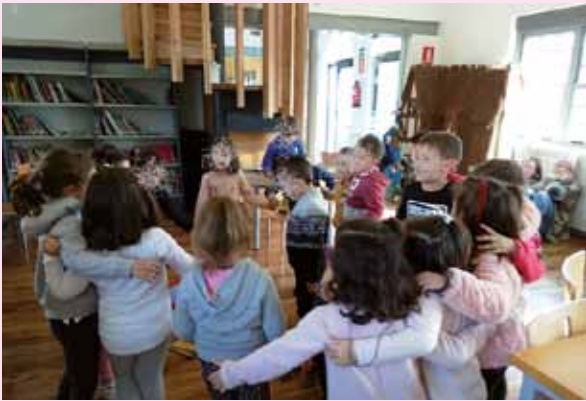
Sesión en la Pequeteca