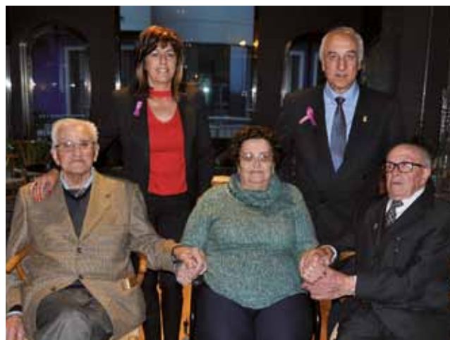
Día de mayores 2018

Las personas que deseen acudir, han de recoger el correspondiente vale al precio de 18 euros en el Ayuntamiento de Coaña o la Biblioteca Municipal antes del 25 de noviembre.