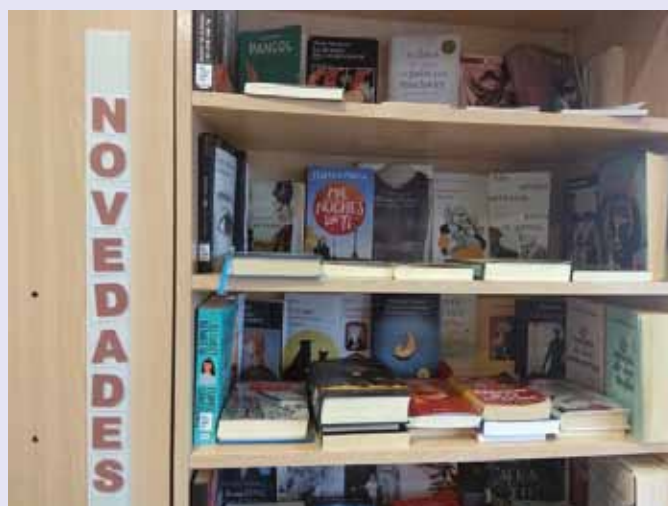
Novedades de la biblioteca

El plan de trabajo anual de la biblioteca titulado “Biblioteca en el medio rural y por el desarrollo” será aprobado próximamente en pleno y guarda estrecha relación con esta subvención.