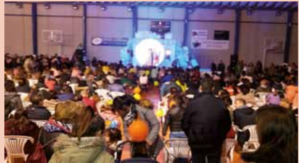
Visita de Papá Noel 2018

El domingo 15 de diciembre recibiremos a Papa Noel en Coaña. La infancia podrá sacarse foto junto a este personaje entrañable de la Navidad. Pero, además, podrán disfrutar de una jornada de diversión y juego en el Polide-