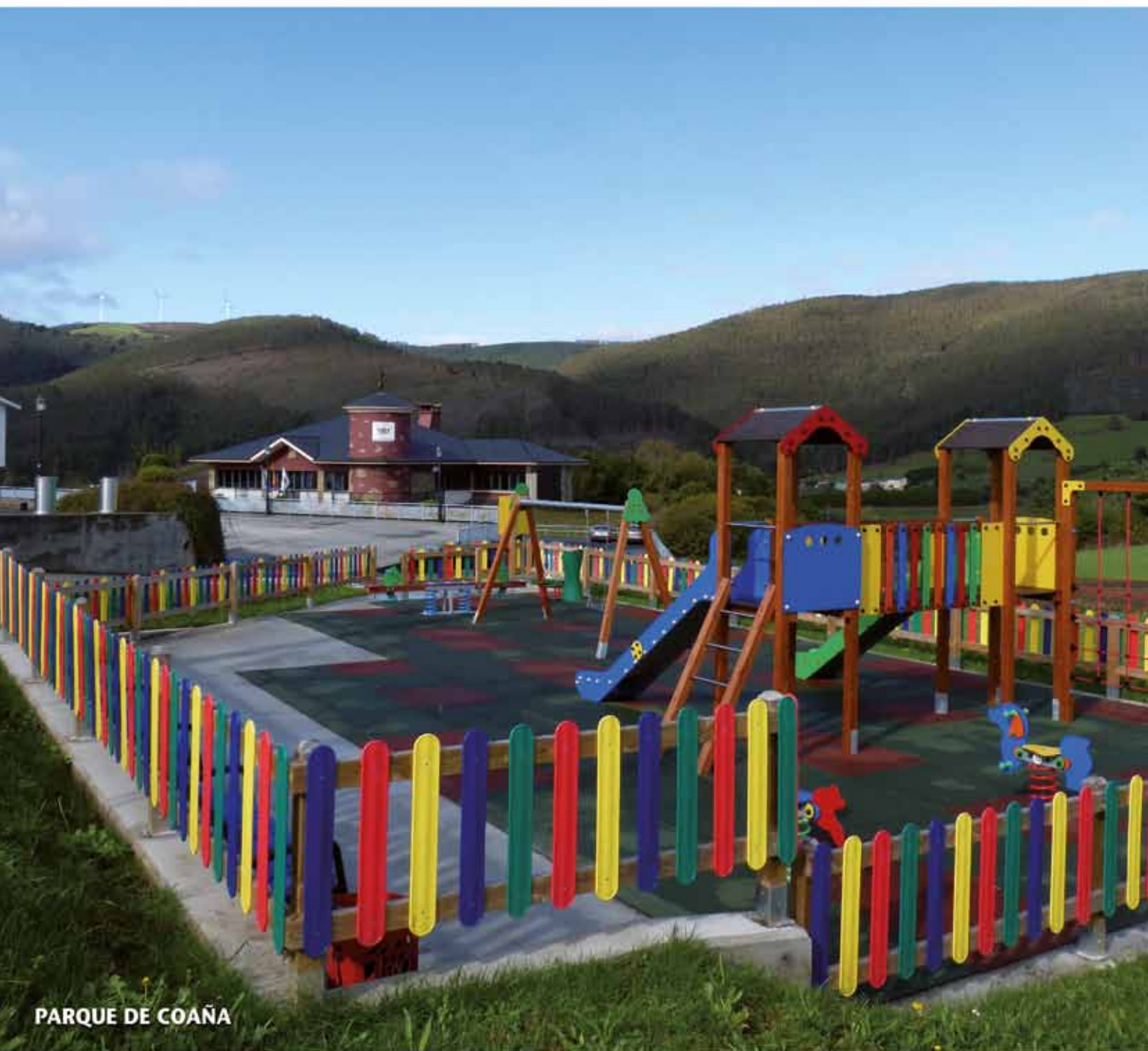
PARQUE DE COAÑA

REVISTA DE INFORMACIÓN MUNICIPAL • Nº 71 • OCTUBRE 2019