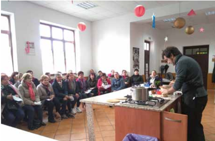
Coaña entre fogones

Retomamos en el último trimestre la programación del proyecto “Coaña entre fogones”, centrando su temática en la elaboración de platos típicos navideños de diferentes lugares del mundo. Un guiño a las tradiciones de otros países en estas fechas tan especiales.