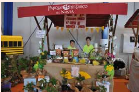
Stand del AMPA en la Feria del 2019

Desde el año pasado, hemos establecido dos colaboraciones que consideramos muy necesarias para que la Asociación de Madres y Padres del Centro, obtenga financiación para los múltiples proyectos que desarrollan. Se trata de la participación de éstos en dos de las actividades que más repercusión tienen en nuestra programación, como son la Feria "Agroarte Coaña" y la "Visita de Papa Noel".