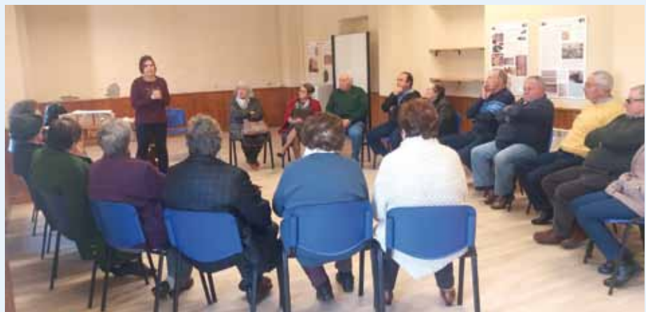
Escuela de Salud 2019

Las próximas sesiones que se llevarán a cabo en las Escuelas Rurales de Cartavio, serán las siguientes: