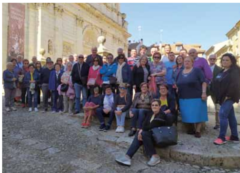
Viaje a Valladolid 2019

El coste del viaje es de 300 euros por persona en régimen de pensión completa en habitación doble, con todas las visitas y desplazamientos incluidos.