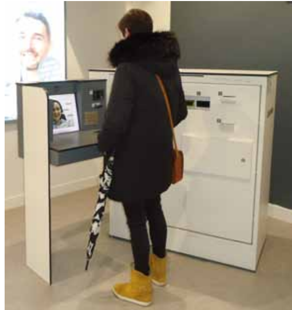
Prototipo de cajero humanizado

Una iniciativa moderna, fácil de utilizar para cualquier ciudadano independientemente de su edad y conocimientos informáticos (no se requieren para el usuario) que esperamos que