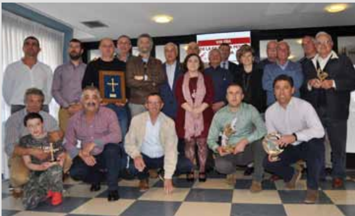
Jornadas de Caza y Pesca 2019

Los amantes de la caza y la pesca, de nuevo tienen en el mes de marzo una cita con sus compañeros de afición en este encuentro que se ha consolidado en el tiempo y cada año aumenta en participación.