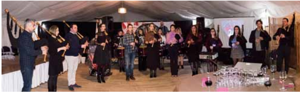
Banda “El Trasnó”

La Banda de Gaitas “El Trasnó” nació el 31 de mayo de 1999 en el seno de la Escuela de Música coañesa como una asociación cultural cuyo objetivo principal