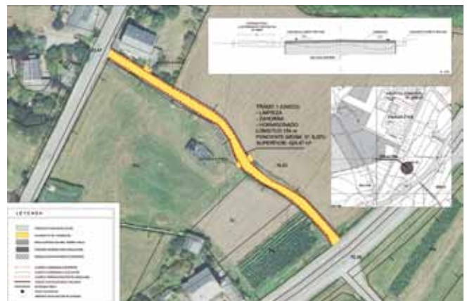
Plano del Caleyón de la Granda

mismo con hormigón armado dado que actualmente cuenta con un pavimento de tierra lo de que dificulta su adecuada utilización. Obra adjudicada en 17.000 euros.