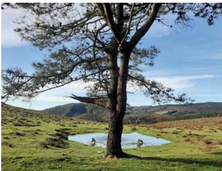
Primer premio juvenil