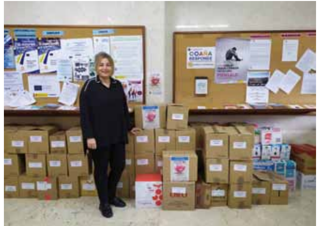
Alimentos recogidos para la campaña

Esta apuesta solidaria puede hacerse de dos formas: comprando una libreta solidaria, que podrá adquirirse por un euro, o a través de las Huchas para la Educación que podrás encontrar en cualquiera de los servicios municipales. Ambas modalidades contribuirán al mismo fin.