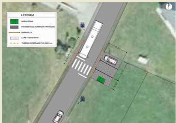
Plano de marquesina El Esteler

escolares, para que las empresas de transporte puedan realizar las maniobras oportunas, garantizando la seguridad de los escolares.