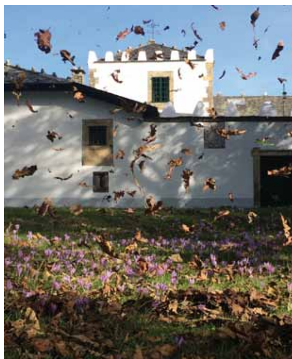
Primer premio infantil