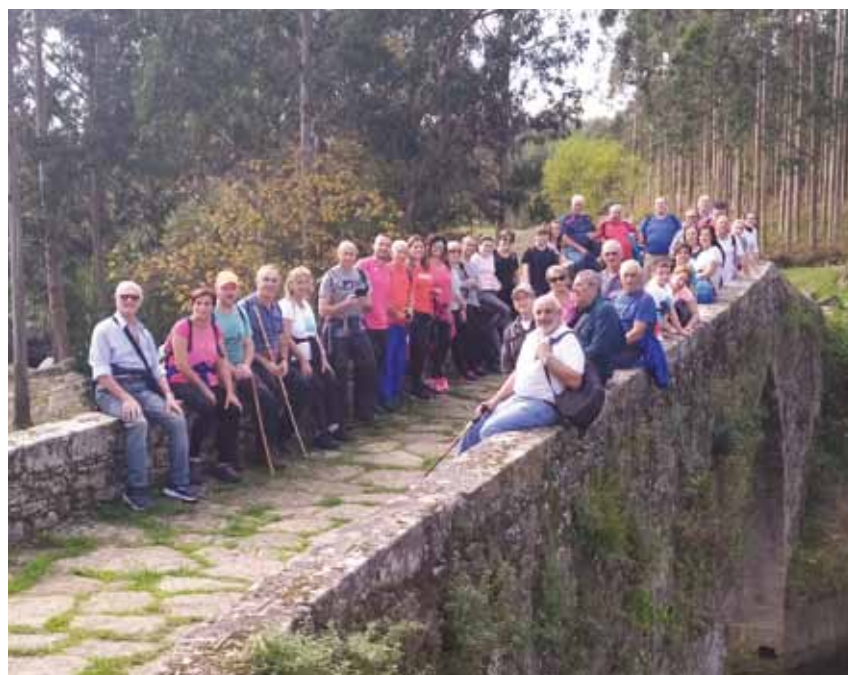
Ruta de Burela a San Ciprián 2019

-RUTA "LOS LLUGARINOS": se desarrollará el domingo 26 de enero. Se trata de una ruta fácil, de 13,5 kilómetros de recorrido, que discurre por el concejo de Valdés, con punto de partida y final en el pueblo de Trevías. El coste de esta actividad es de 23 euros (incluye desplazamiento y comida).