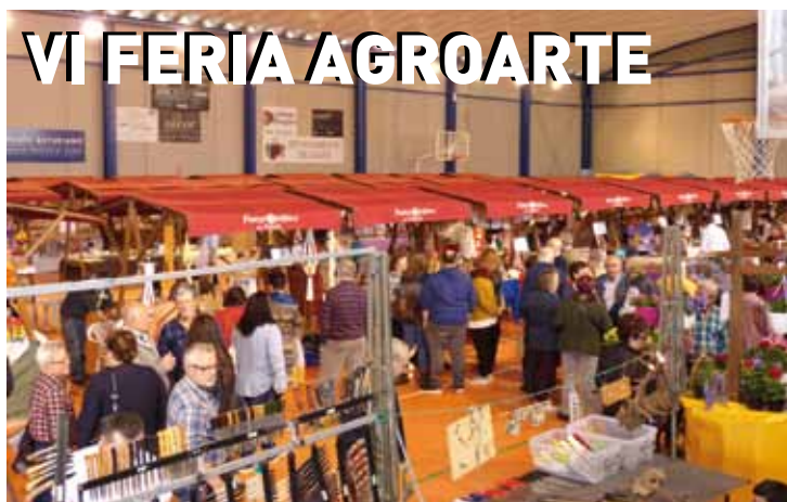
Edición Agroarte 2019

Además, se ha anulado el precio de la segunda y sucesivas matrículas, es decir, la matrícula al gimnasio o a cualquier actividad deportiva, siempre será GRATIS independientemente de las veces que el usuario de las instalaciones, se haya dado de baja.