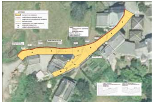
Plano camino de Pumarín

Se encuentra adjudicada la obra de adecuación del Caleyón de la Granda en Jarrío, la cual supondrá la pavimentación del