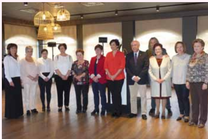
Día de la mujer 2019

Esta edición se desarrollará el sábado 7 de marzo y deseamos se convierta un año más, en una jornada cargada de simbolismo en la lucha por la igualdad y por el empoderamiento de la mujer.