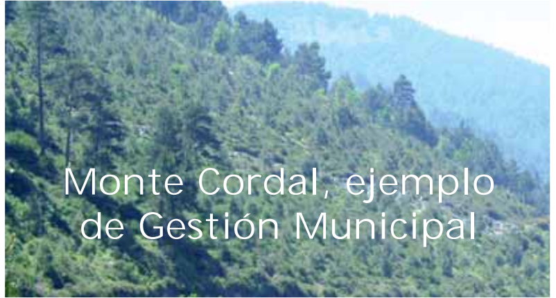
Monte Cordal, ejemplo de Gestión Municipal

Además, ahora se están realizando talas en estos montes y NORFOR debe abonar al Ayuntamiento, en los noventa días siguientes a la finalización de cada una de estas cortas de eucaliptos, el 25% del precio de mercado de la madera, tomándose como referencia el del metro cúbico sólido de madera en pie, para pasta de celulosa.