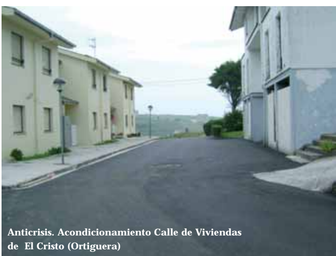
Anticrisis. Acondicionamiento Calle de Viviendas de El Cristo (Ortiguera)