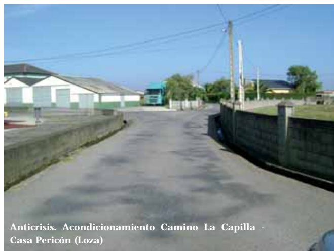
Anticrisis. Acondicionamiento Camino La Capilla - Casa Pericón (Loza)