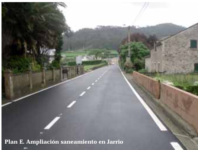
Plan E. Ampliación saneamiento en Jarrio