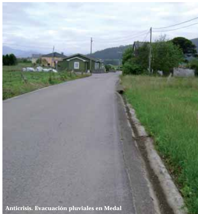
Anticrisis. Evacuación pluviales en Medal