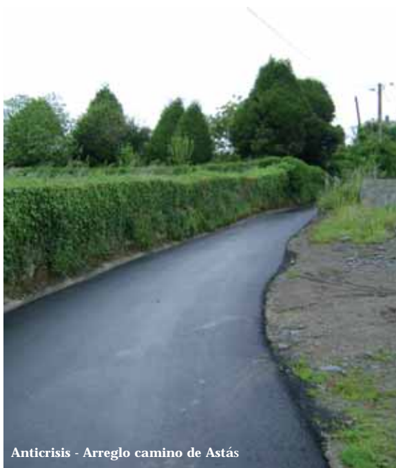
Anticrisis - Arreglo camino de Astás