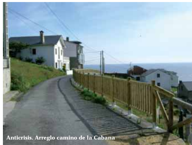
Anticrisis. Arreglo camino de la Cabana