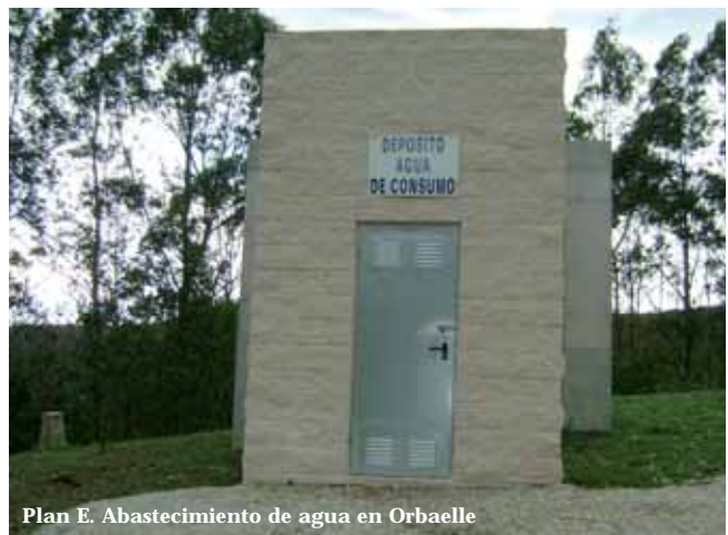
Plan E. Abastecimiento de agua en Orbaelle