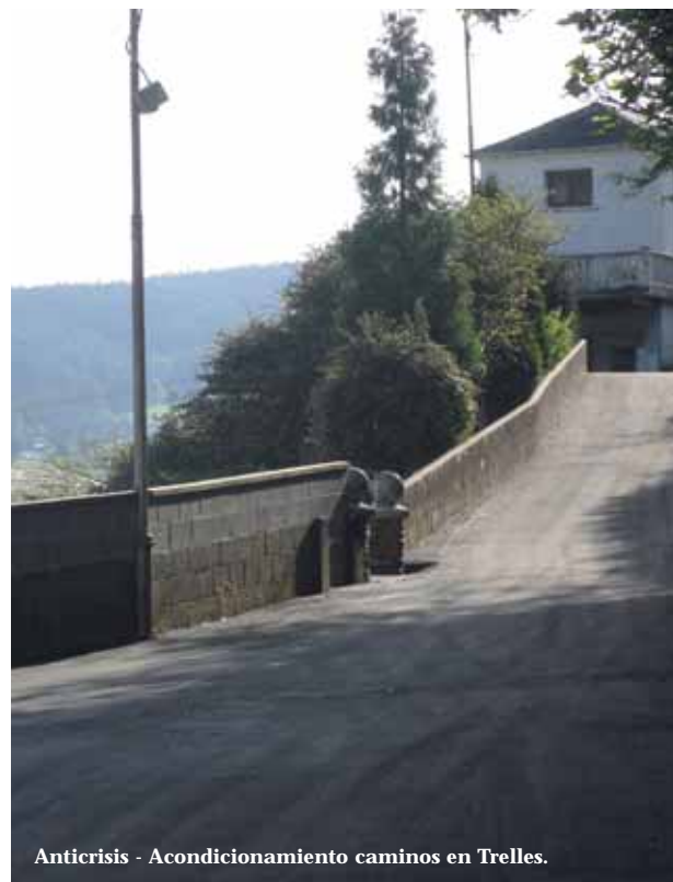
Anticrisis - Acondicionamiento caminos en Trelles.

El Ayuntamiento de Coaña ha hecho su trabajo y ha trasladado la situación al Principado que es quien debe dar respuesta y solucionar esta situación